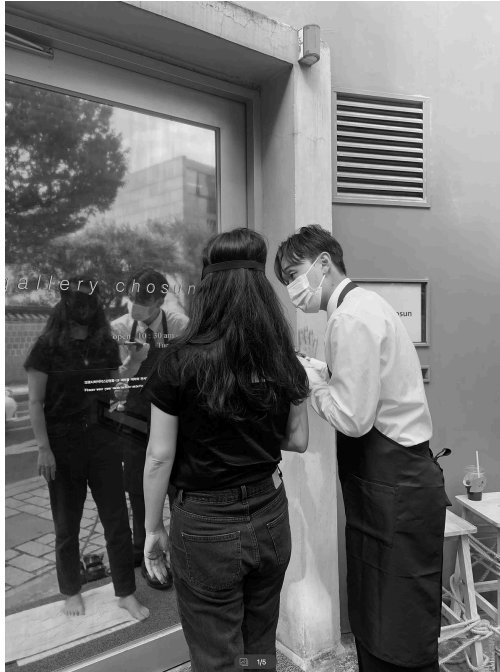
박관우, <졸다가 꾸 꿈>, 생성형 사건, 가변크기, 2022 Kwanwoo Park, <The Dream during the Nap>, Generative Event, Size Variable, 2022