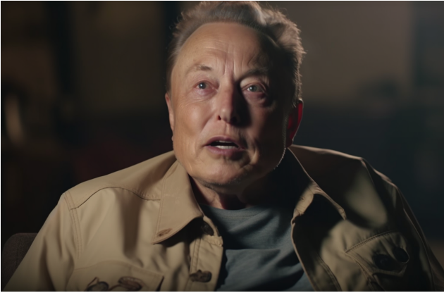
〈머스크 멜론〉, 미드저니를 활용하여 추출된 가공사진, 13x18cm, 2023 〈Musk Melon〉, Fake portrait produced using Midjourney, 13 x 18cm, 2023